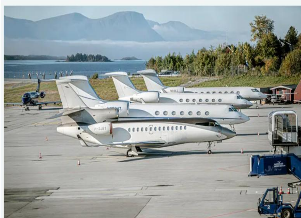
PÅ ÅRØ: Fem privatfly landet på Molde lufthavn i løpet av to dager i september 2019, minst ett av dem kom direkte fra Moskva.